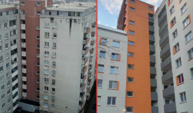
Vorher-Nachher-Foto zur aktuellen Sanierung der Schwarzenbergstraße in Hanau