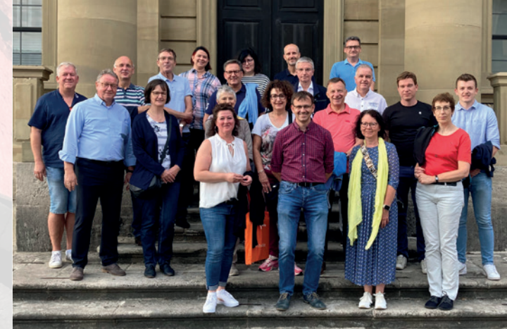
Impressionen von der gemeinsamen Exkursion der AGs Finanz aus Hessen und Bayern nach Würzburg

Die Pandemie hat auch die 15 Arbeitsgemeinschaften des RKW Hessen vor Herausforderungen gestellt. Um gemeinsam der Krise zu trotzen, konnten Fortbildung und Vernetzung jedoch in 2022 mit neuen Formaten weiter vorangetrieben werden. So etwa bei fach- und bundesländerübergreifenden Veranstaltungen, die online, aber auch vor Ort stattfanden.